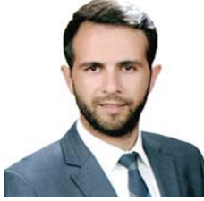
Hüsnü Salih YILMAZ Meclis Başkanı